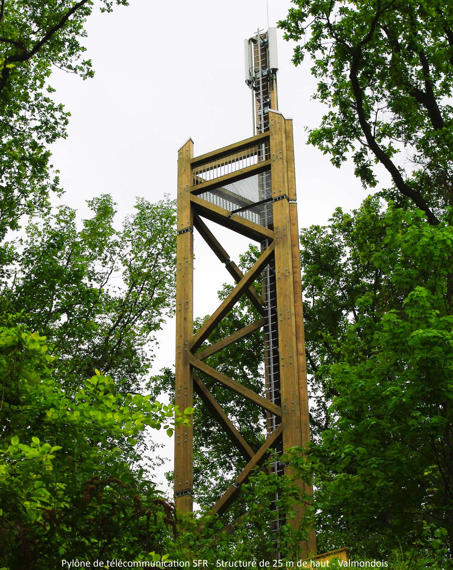
Pylône de télécommunication SFR - Structure de 25 m de haut - Valmondois