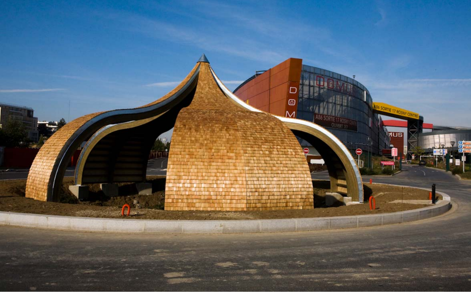
Rond point (Domus) - Structure lamellée collée + bardeaux mélèze - Rosny